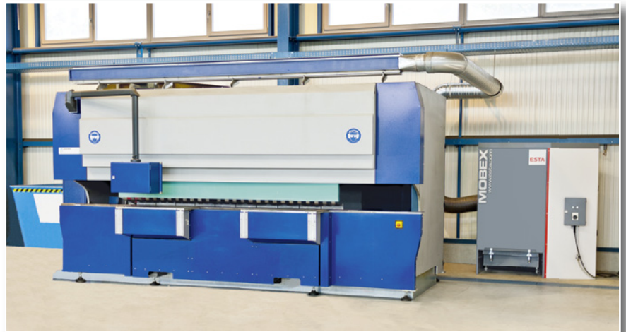
MOBEX an einer Fräsmaschine